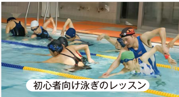
初心者向け泳ぎのレッスン

重力から解放され、身も心も軽くなります。水の抵抗で筋トレ効果がある他、水圧で血液循環がとても良くなります。