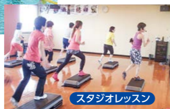
スタジオレッスン