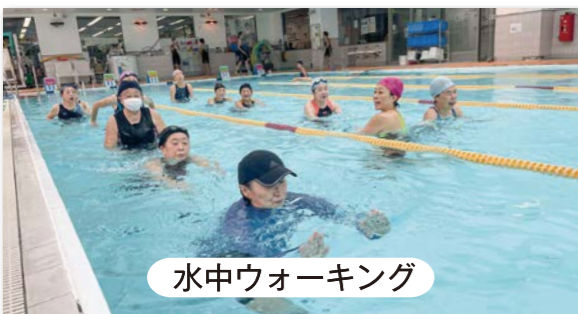
水中ウォーキング

呼吸を意識した、ゆっくりとした動きで、心とからだの緊張をとり、自律神経の働きを整えます。